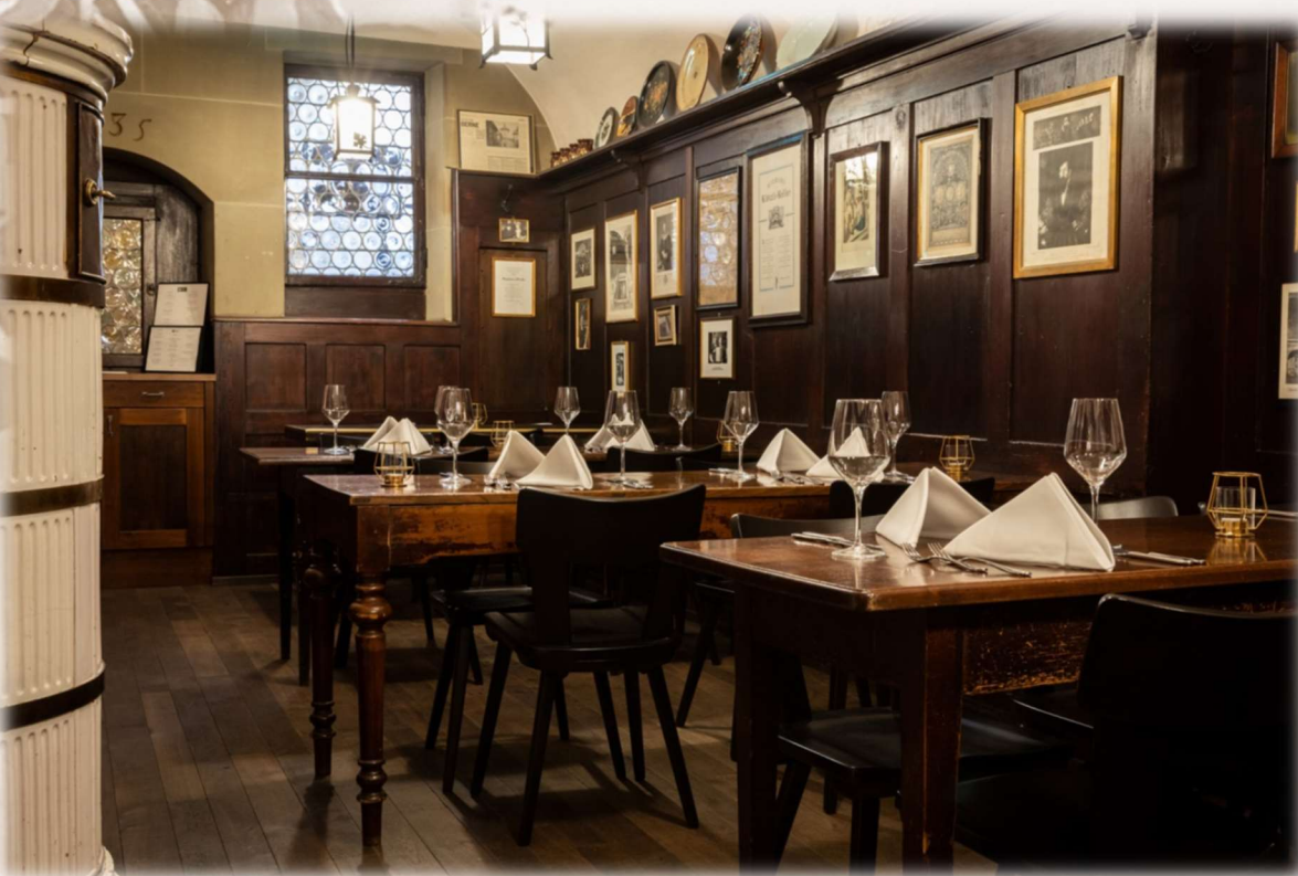
Weinstube "1635" Platz bis zu 25 Personen

Wenn nichts Anderes vermerkt ist, verwenden wir ausschliesslich Fleisch mit Schweizer Herkunft.