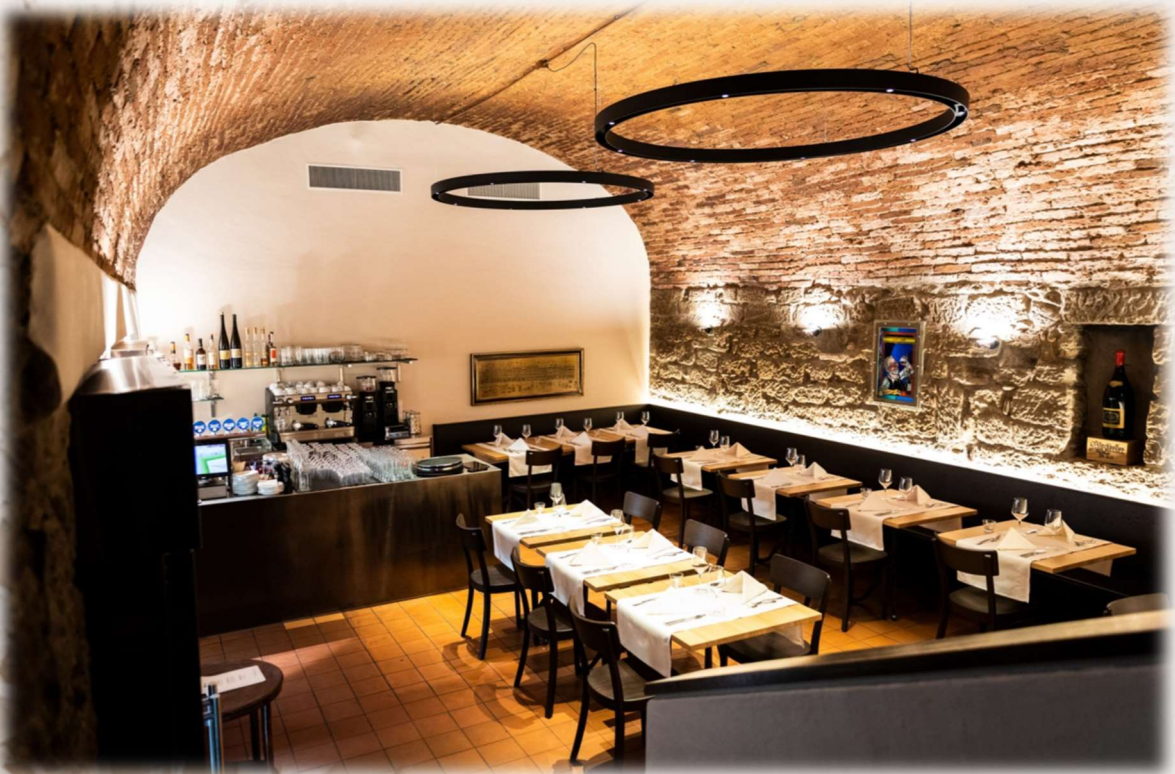
Gewölbekeller Platz bis zu 40 Personen